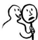
bonheur ou malheur.jpg