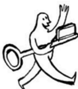
avoir la clef (2).jpg