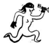
chapeuse de clés.jpg