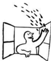
à la fenêtre avec confettis.jpg

Retirez la feuille et laissez-la ensuite sécher une à deux heures