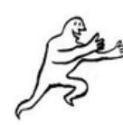
courir après quelque chose.jpg