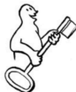
avoir la clef (3).jpg